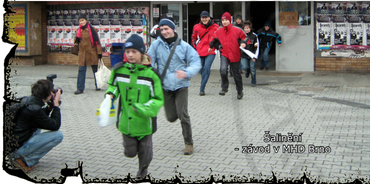
Šalinění - závod v MHD Brno

SPJF, Výročním ohněm adamovských klubů, zážitkovou akcí Míč, Kofolovými hrami nebo tradiční hrou Stínadla se bouří v Adamově.