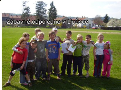
Zábavné odpoledne v Lipůvce

Díky dotaci od Jihomoravského kraje Perpetuum může půjčovat své vybavení dalším členům SPJF. Jedná se například o čluny, týpí, horolezecké vybavení, sněžnice atd. Plný výčet je k dispozici na www.iklubovna.cz/jmp .