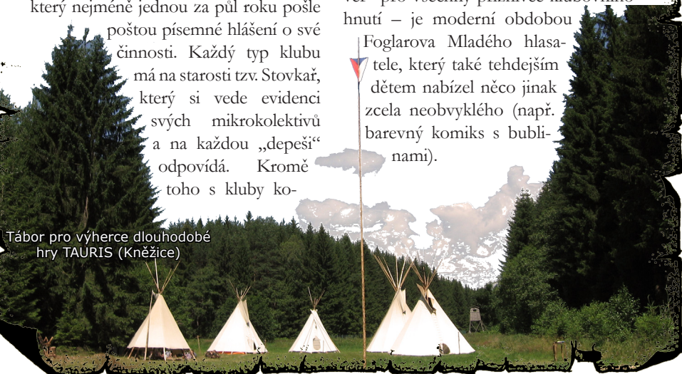
Tábor pro výherce dlouhodobé hry TAURIS (Kněžice)

Foglarova Mladého hlasatele, který také tehdejšími dětem nabízel něco jinak zcela neobvyklého (např. barevný komiks s bibli-nami).