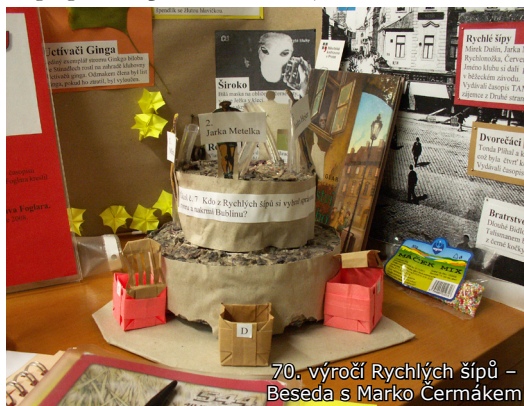
70. výročí Rychlých šípů – Beseda s Marko Čermákem

V roce 2008 podnítila Pražská pobočka vznik Akademie Jaroslava Foglara. První kolegium se konalo 16. 10., v roce 2008 se pak uskutečnila ještě dvě další.