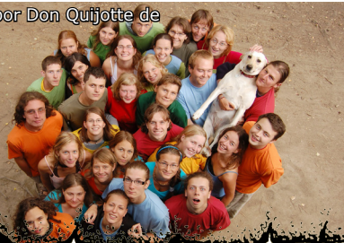
Tábor Don Quijotte de

Činnost je směřována především pro středoškolskou a vysokoškolskou mládež z Třebíče a okolí a pro odrostlé členy SPJF (14–26 let). Sídlo je v „Domečku“ v areálu Katolického gymnázia v Třebíči. Kromě pravidelných „heren“ a „čajoven“ jsou zde pořádány koncerty, cestovatelské besedy, výstavy a další akce pro mladé. Objekt slouží také jako základna pro víkendové přespávání klubů a oddílů.