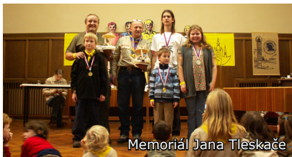
Memoriál Jana Tlěskače