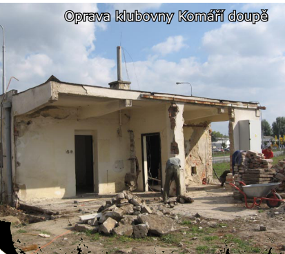
Oprava klubovny Komáří doupe

Na jaře roku 2008 opět pokračovala zábavná herní odpoledne pro neorganizovanou mládež ve věku 3–14 let v obcích převážně severně od Brna: Svitávka (24. 4.), Zastávka u Brna (11. 5.), Lipůvka (15. 6.). Do pásma her byly zapracovány některé nové programy s cílem propagace nejen samotného SPJF, ale hlavně dlouhodobé hry pro kluby.